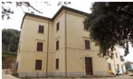
Villa Battistini, sede del Conservatorio

Sono 106 gli studenti iscritti alla sede distaccata di Rieti