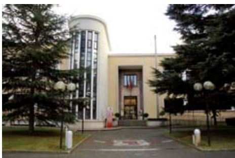
La sede della Provincia di Rieti

Il Terminillo rinasce e tornerà ad essere la Montagna di Roma. La Regione Lazio ha infatti stanziato un finanziamento di 20 milioni di euro per la realizzazione