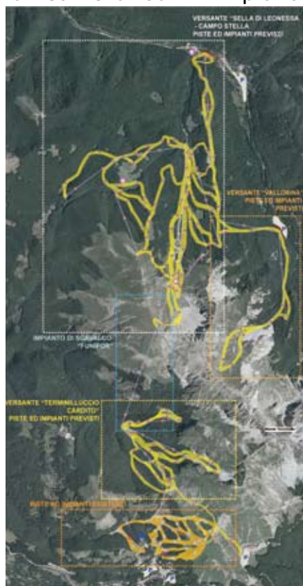
Come sarà l'intero bacino sciistico del Terminillo

impianti di risalita che serviranno circa 36 chilometri di nuove piste con diversi gradi di difficoltà. Nel complesso, quindi, il futuro Terminillo si svilupperà su 42 chilometri di piste, distribuite sui territori comunali di Rieti, Micigliano, Cantalice e Leonessa, a fronte degli odierni 6 chilometri e di soli 4 impianti.