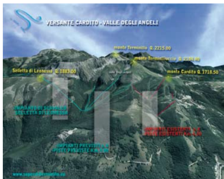
in alto il rendering del progetto - in basso gli impianti di risalita

Il progetto interesserà i comuni di Rieti, Micigliano, Cantalice e Leonessa